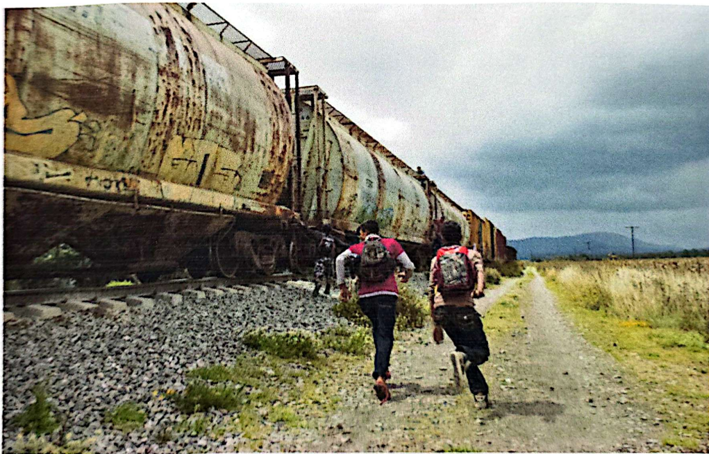
México. Migrantes intentan trepar a un tren que transporta mercancía para seguir su camino.

Muchos de los centro americanos o bien paisanos de otros estados de la República Mexicana escogen la Zona Centro-Sur para descansar o quedarse por un tiempo indefinido, ya que les resulta una Zona tranquila donde el índice de delitos no es tan alto a comparación de otras ciudades lo que les da un poco de seguridad.