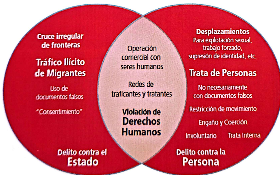
Imagen copiada de reportaje de trata de personas. UNICEF